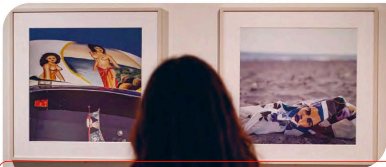
Exposición Pérez Siquier. Colecciones Fundación MAPFRE en la sala de Las Palmas de Gran Canaria.

En Fundación MAPFRE Canarias seguiremos escuchando, acompañando y apoyando a las personas de nuestro ecosistema, tanto de forma presencial con las acciones que llevamos a cabo en las 8 islas, como a través de Experimenta FMC, un espacio de encuentro para crear conexiones e impulsar proyectos del que ya forman parte más de 5.300 personas y entidades sociales y culturales de Canarias.