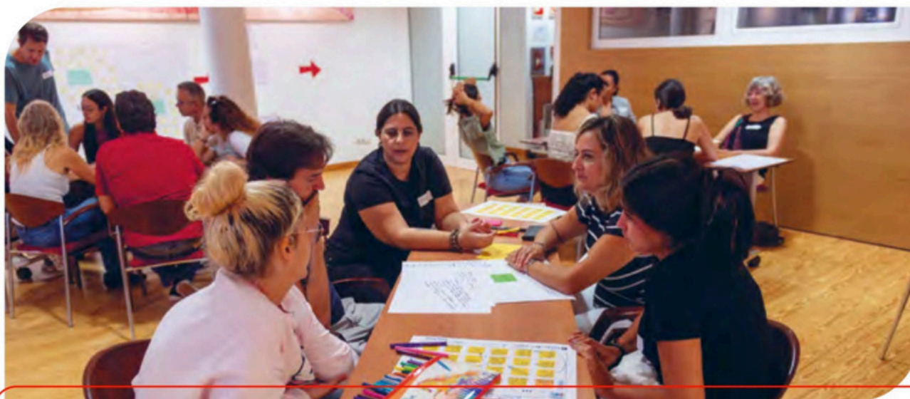
Imagen de una de las sesiones del primer Laboratorio de Innovación Social de Fundación MAPFRE Canarias «Experimenta el LAB Inclusión» celebrado con la colaboración de Plena Inclusión Canarias en el mes de octubre de 2024.

En 2024 pusimos en marcha el Laboratorio de Innovación Social donde, con el primer reto «Experimenta el LAB INCLUSIÓN», hemos trabajado en la inclusión de las personas con discapacidad en su comunidad, reafirmando así nuestro compromiso con la innovación social y la mejora de la calidad de vida de las personas más vulnerables de las Islas Canarias. En este laboratorio los participantes dieron respuesta al reto de crear comunidades más inclusivas y de él surgieron cuatro proyectos que se implementarán en el 2025.