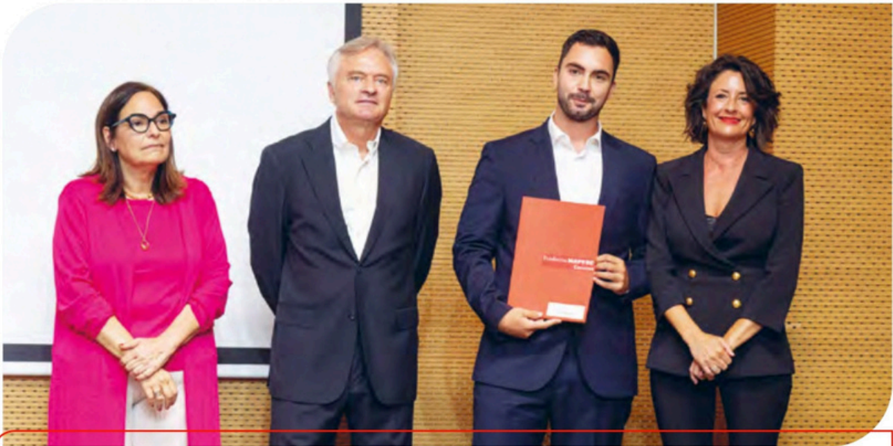
Acto de entrega de credenciales de las becas de internacionalización para realizar prácticas profesionales en Estados Unidos y de estudios de posgrado en STEM, ADE y Música celebrado en el mes de julio en Las Palmas de Gran Canaria.