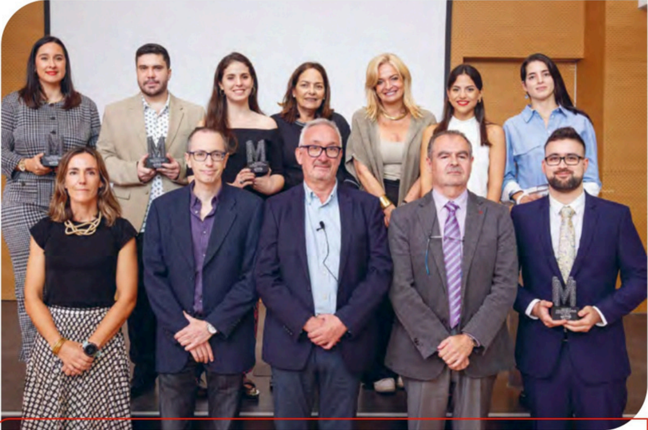
Acto de entrega de los Premios MIR al médico interno residente más destacado y de las becas de investigación médica de la Fundación MAPFRE Canarias, celebrado en el mes de diciembre de 2024 en Las Palmas de Gran Canaria.