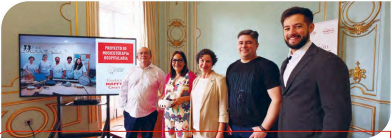
Proyecto de Musicoterapia Hospitalaria y RV de la Fundación MAPFRE Canarias.