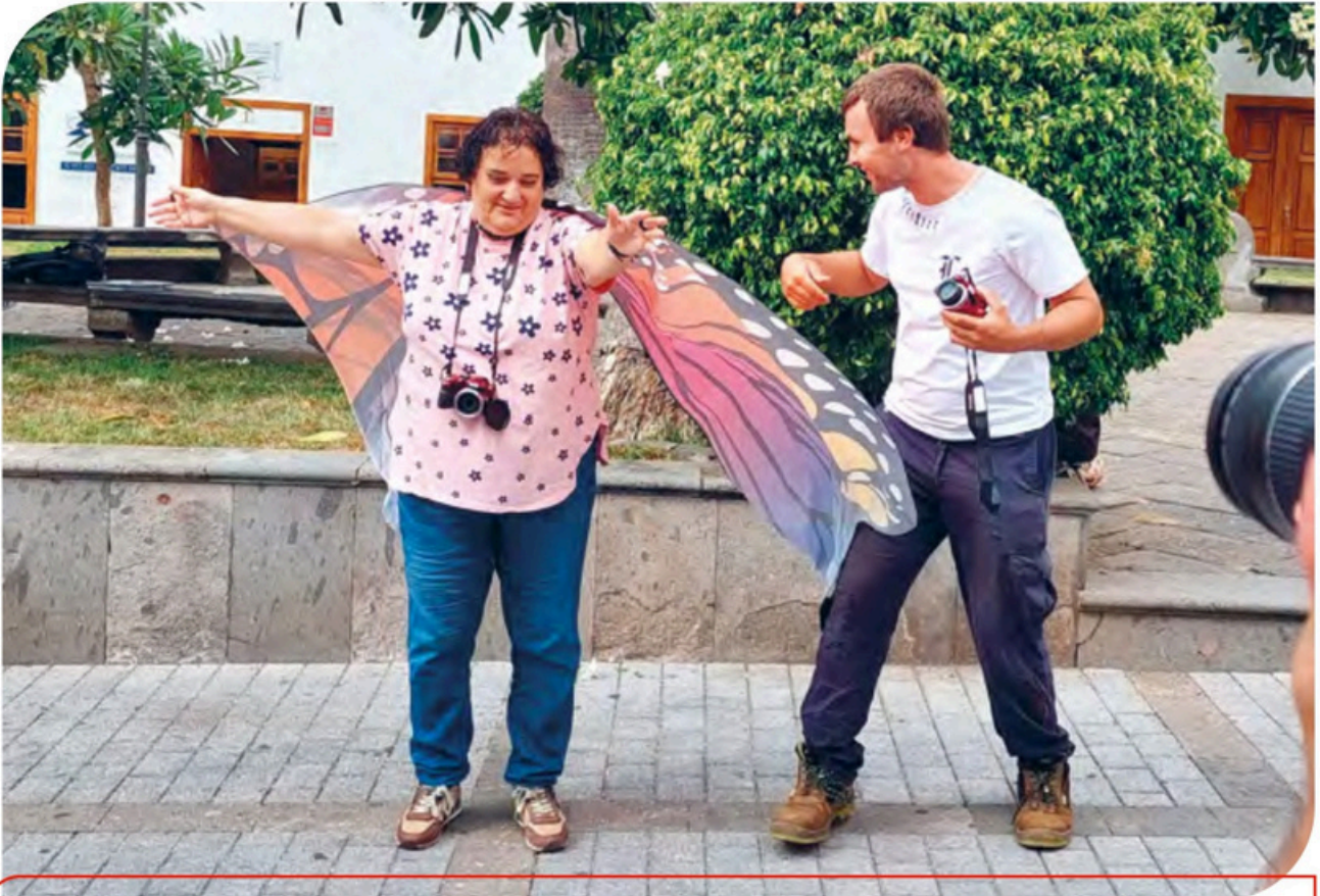
Proyecto ZOOM Social desarrollado durante 2024 con la Asociación Karmala Cultura en la isla de La Palma.

A través del área Social, organizamos anualmente una convocatoria pública de Ayudas a Proyectos Sociales, con el fin de apoyar diez nuevas iniciativas dirigidas a mejorar la vida de niños, adolescentes y personas con discapacidad física, sensorial, intelectual y psicosocial en el ámbito de la comunidad autónoma canaria. A lo largo de todo el año hemos tenido la oportunidad de acompañar y trabajar con la Asociación de Familias de Personas con Autismo de Las Palmas; la Asociación Nuevo Futuro de Las Palmas; la Asociación Compañía Teatral Actúa 7, Acción cultural, social y artística; la Asociación Plena Inclusión Canarias; la Asociación AFES Salud Mental; Asociación para el Desarrollo del Niño y del Adulto Vitaliti; Asociación Karmala Cultura; la Asociación Horizonte y la Asociación de Discapacitados del Sur.