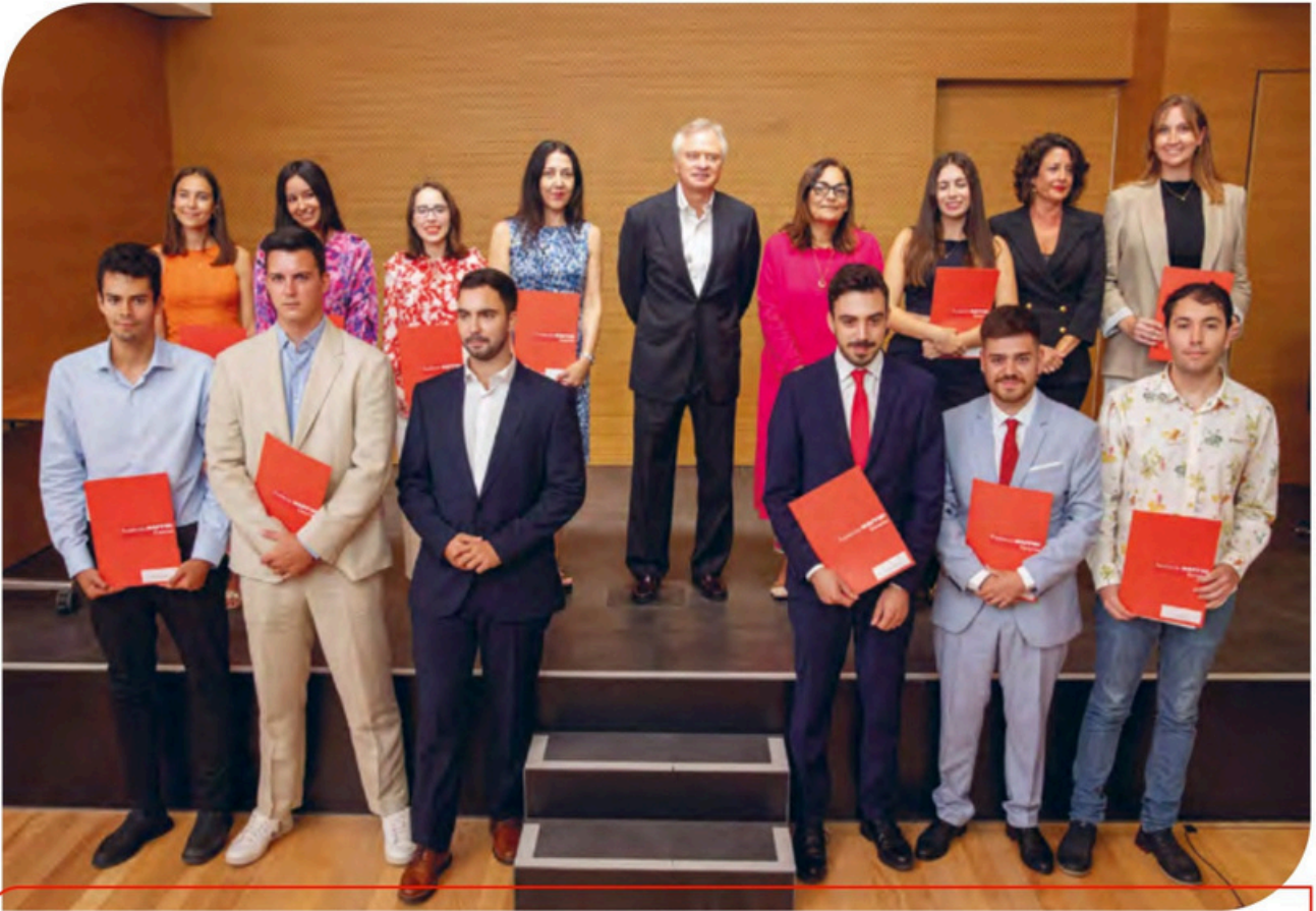
Acto de entrega de credenciales de las becas de internacionalización para realizar prácticas profesionales en Estados Unidos y de estudios de posgrado en STEM, ADE y Música celebrado en el mes de julio en Las Palmas de Gran Canaria.

Nuestro Programa de Becas hace posible que jóvenes universitarios canarios puedan realizar prácticas profesionales y continuar sus estudios de posgrado en ciencias, tecnología, administración de empresas o música en diferentes destinos nacionales e internacionales.