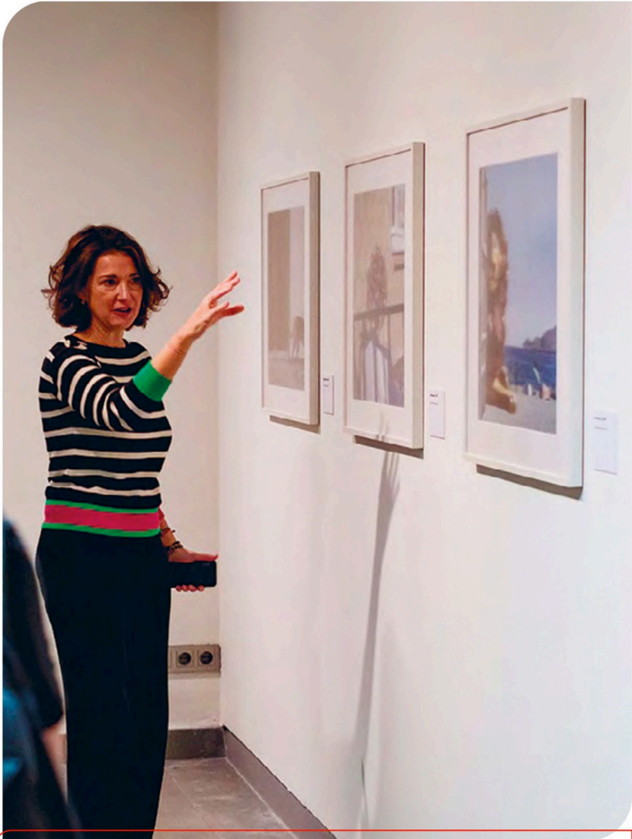
Inauguración de la Exposición Pérez Siquier. Colecciones Fundación MAPFRE en la sala de Las Palmas de Gran Canaria en el mes de noviembre de 2024.