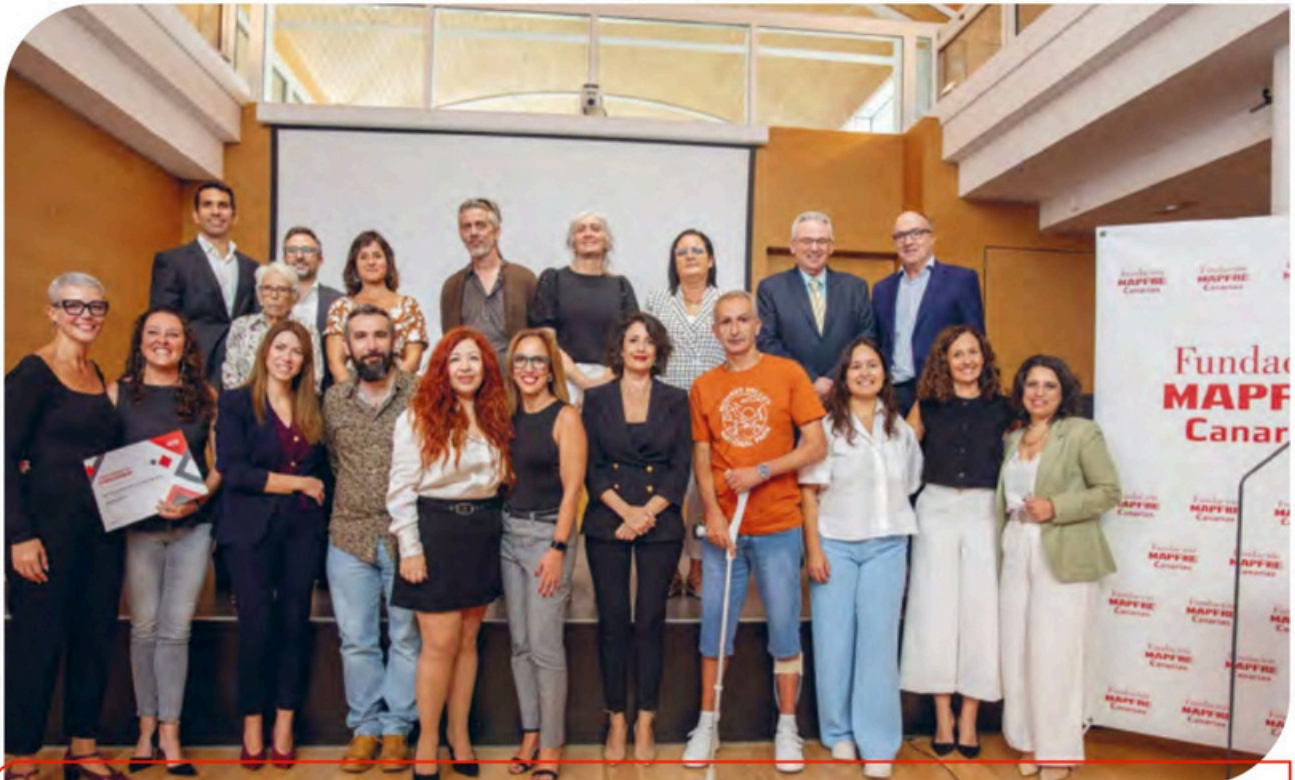
Foto de familia del acto de entrega de ayudas sociales de la Fundación MAPFRE Canarias para 2025 celebrado en el mes de noviembre en la sede institucional de Las Palmas de Gran Canaria. En la imagen aparecen representantes de la Fundación, de las entidades beneficiarias de las ayudas y miembros del voluntariado de MAPFRE Canarias que forman parte del Programa de Embajadores.

En nuestro afán de mejora constante y aprovechando al máximo las sinergias del Grupo MAPFRE para ampliar el alcance de nuestra acción social continuamos con el Programa Embajadores, compuesto por miembros del voluntariado de MAPFRE Canarias que han visitado durante el año los lugares donde se han llevado a cabo nuestros proyectos. Gracias a la labor de enlace de los embajadores hemos detectado nuevas necesidades y acciones complementarias en las que han participado otros voluntarios de MAPFRE Canarias. En 2025 apoyaremos diez proyectos nuevos que han sido seleccionados entre las más de 64 solicitudes recibidas en la tercera convocatoria.